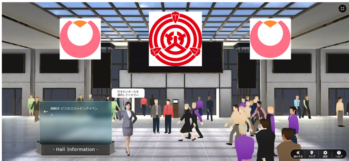
本事業の協力会社である株式会社ジクウが提供するメタバースイベントプラットフォーム“ZIKU”