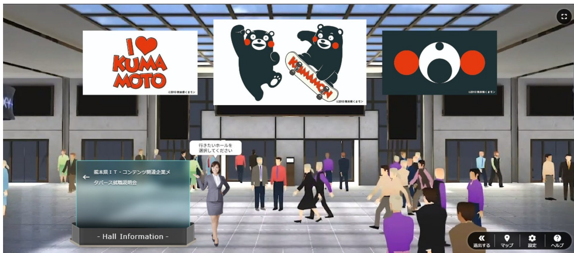
本事業の協力会社である株式会社ジクウが提供するメタバースイベントプラットフォーム“ZIKU”