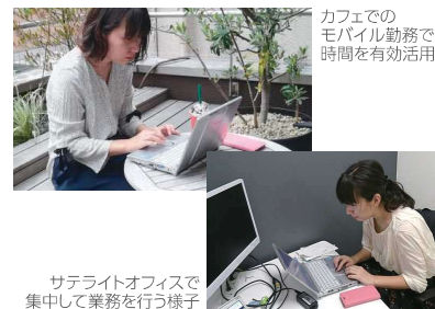
カフェでのモバイル勤務で時間を有効活用